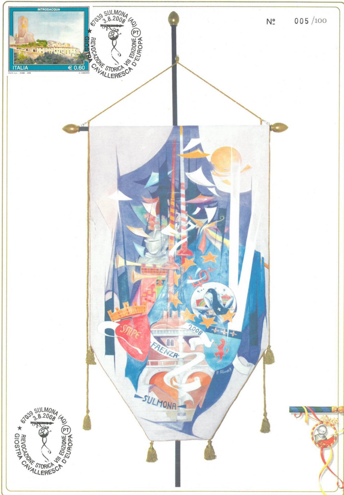
Palio della "Giostra Cavalleresca d'Europa" - Edizione 2008 - Autore: m. Renato Albonetti